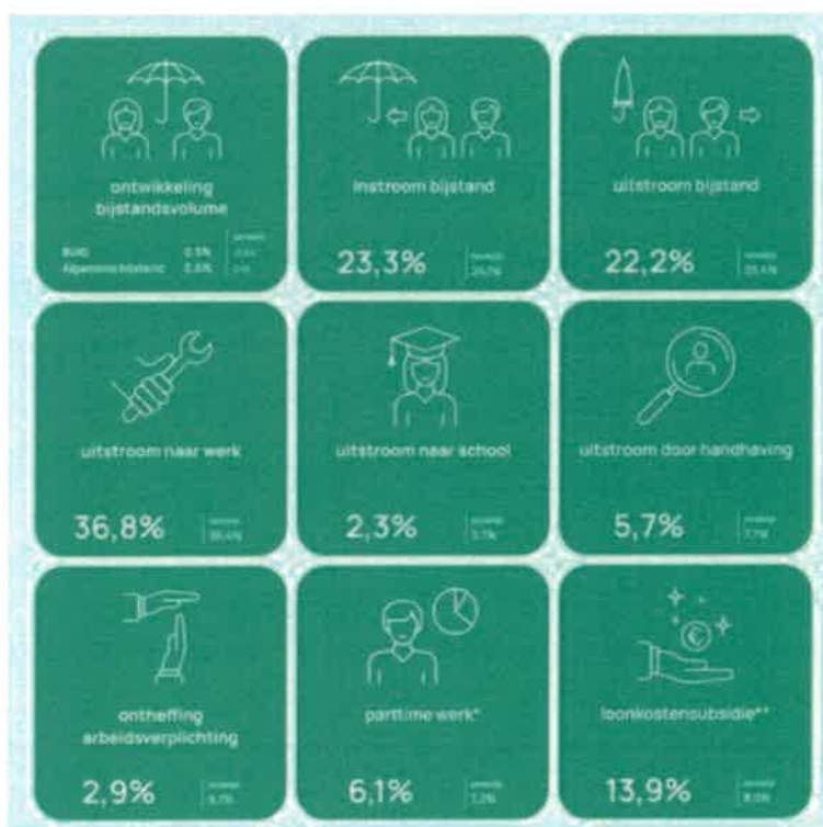
Figuur Jaarkaart Divosa benchmark 2023 voor de gemeente Hendrik-Ido-Ambacht