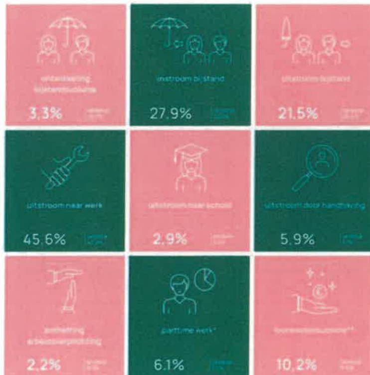
Figuur Jaarkaart Divosa benchmark 2022 voor de gemeente Hendrik-Ido-Ambacht